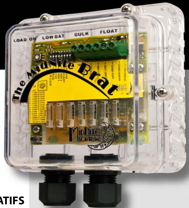
Paramètres principaux du chargeur (interrupteur à 8 positions)

Eclairage / contrôle de la charge (commutateur rotatif à 16 positions) 10 AWG Terminal Max Bloquer